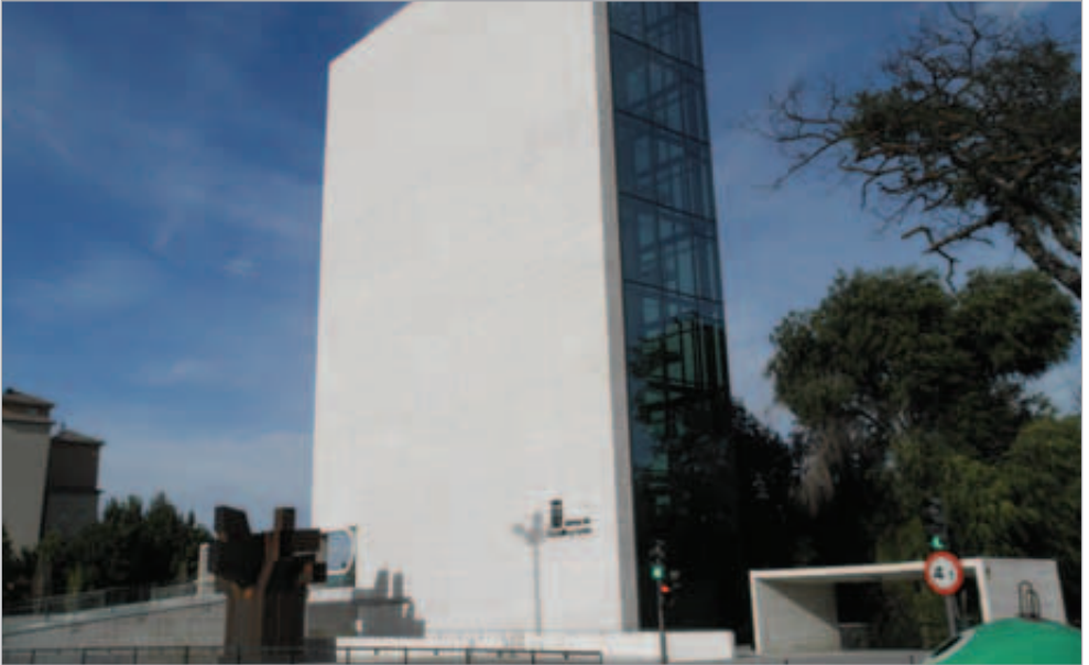
EDIF. ADMIN. DE LA JUNTA DE CASTILLA Y LEÓN (F.R.M.) Valladolid

URSA AIR P5858 Panel aluminio Al ..... 1.500 m 2