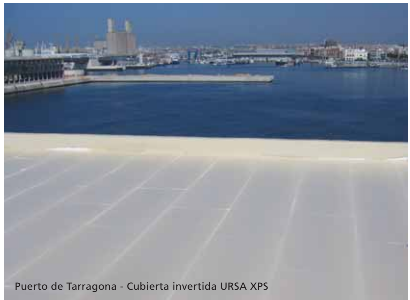
Puerto de Tarragona - Cubierta invertida URSA XPS

___m 2 aislamiento de poliestireno extruido UNE-EN 13164, resistencia a compresión ≥500 kPa, espesor ___mm, resistencia térmica ___m 2 K/w, con la superficie lisa y canto a media madera, de la serie URSA XPS NV L, colocado sin adherir.