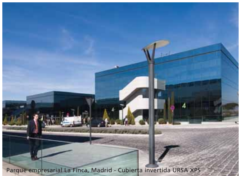
Parque empresarial La Finca, Madrid - Cubierta invertida URSA XPS

___m 2 aislamiento de poliestireno extruido UNE-EN 13164, resistencia a compresión \geq 300 kPa, espesor ___mm, resistencia térmica ___m 2 K/w, con la superficie lisa y canto a media madera, de la serie URSA XPS NIII L, colocado sin adherir.