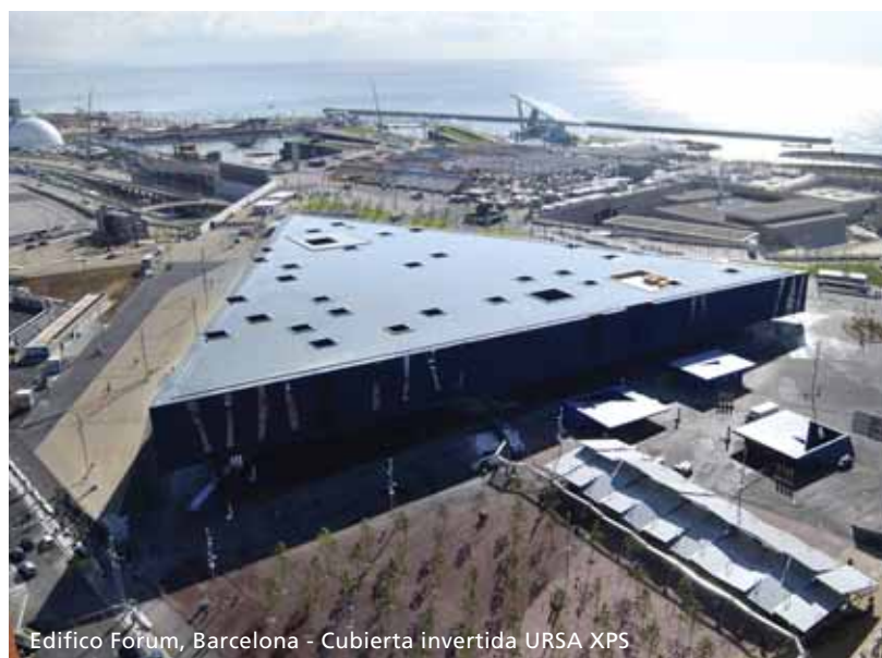
Edificio Forum, Barcelona - Cubierta invertida URSA XPS

___m 2 aislamiento de poliestireno extruido UNE-EN 13164, resistencia a compresión \geq 300 kPa, espesor ___mm, resistencia térmica ___m 2 K/w, con la superficie lisa y canto a media madera, de la serie URSA XPS NIII L, colocado sin adherir.